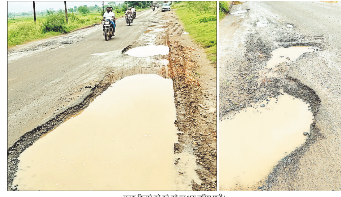
सड़क किनारे बने बड़े गड्डे पर भरा बारिश पानी।